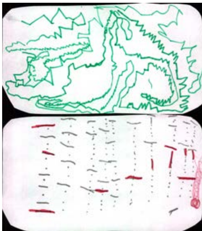
Imagen 2: Partituras realizadas a partir de sonidos del ambiente.

a las convenciones de escritura, su función social, la huella que significa escribir para no olvidar.