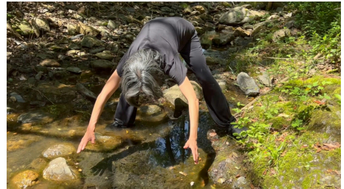
Low water reading. Ver video

Residencia de arte en Madremanya, Cataluña, España, abril-mayo de 2023