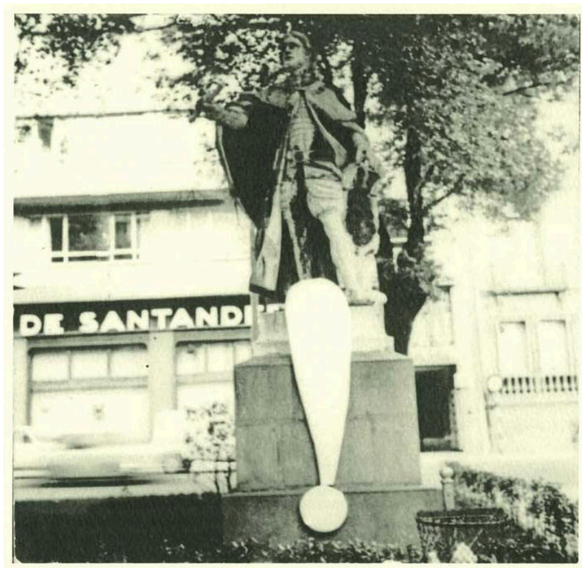
Alain Arias-Misson. The Punctuation Public Poem (1972) Pamplona